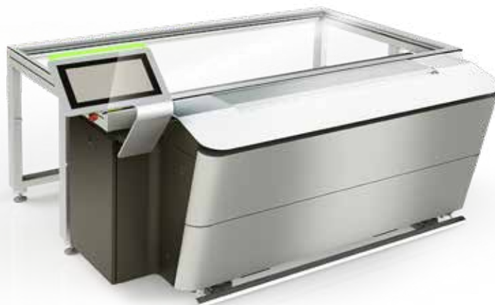
CDI Crystal 4835