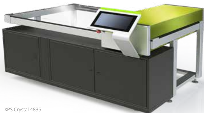
XPS Crystal 4835