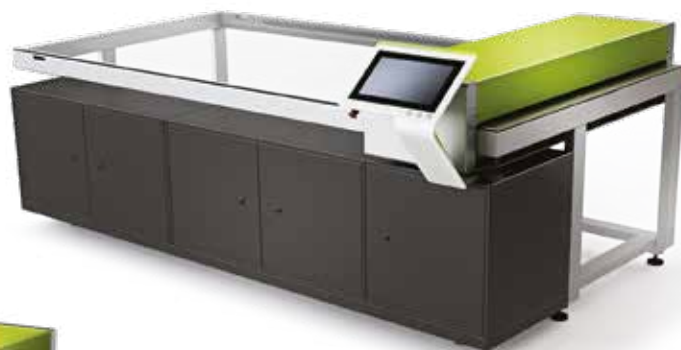
XPS Crystal 5080