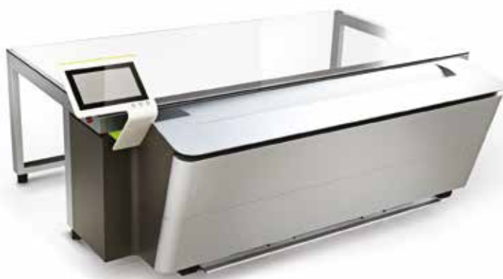
CDI Crystal 5080