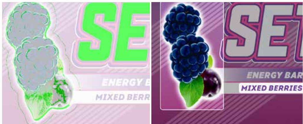
Comparsa di punti

ArtPro+ consente di aprire qualsiasi risorsa di imballaggio in formato PDF, PDF normalizzato o ArtPro sia su Mac che su PC.