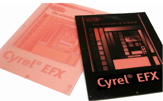
DuPont™ Cyrel® EASY FAST EFX

Lastra digitale ad alto trasferimento con punto digitale a testa piatta incorporato