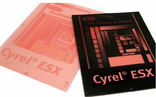
DuPont™ Cyrel® EASY ESX

Punto digitale a testa piatta incorporato nella lastra per una stampa di alta qualità