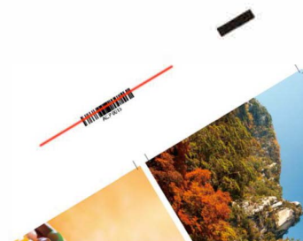
Lettoce codici a barre