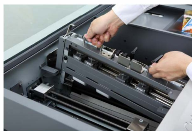
Unità di perforazione