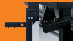
Sistema Feed Adjuster anteriore.

Il sistema di ventilazione ottimizzato mantiene il materiale in posizione per tutto il processo di stampa, assicurando risultati perfetti. Il sistema Roland Feed Adjuster, offre un trascinarsi del materiale preciso, che assicura all'operatore qualità e produttività. Con il riavvolgitore per la carta sublimatica, le operazioni di trasferimento a caldo delle grafiche sono facilitate dal perfetto riavvolgimento del rotolo stampato.