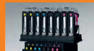
Roland Ink System.

* iPad è un marchio registrato Apple, Inc.