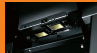
Doppia testa di stampa sfalsata.

Struttura robusta e doppia testa sfalsata, Texart XT-640 è progettata per soddisfare necessità produttive con velocità di stampa fino a 63m 2 / h. XT-640 offre stabilità, qualità di stampa e eccellenti prestazioni anche ad alte velocità. Per riprodurre ogni gradazione e dettaglio, ogni testa ha sette livelli di goccia variabile per una qualità senza precedenti.