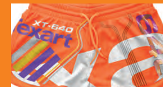
Arancione e viola per stampe brillanti. Neri pieni per sfumature perfette. Light ciano e light magenta per passaggi tonali di eccezionale dettaglio.

L'avanzata tecnologia di controllo di stampa della XT-640 combinata agli inchiostri Texart produce stampe di alta qualità e immagini nitide, dai colori vivaci e brillanti. Per ottenere il massimo della produttività, la configurazione a 4 colori offre dettagli e contrasti eccezionali a velocità di stampa impressionanti. Amplia la gamma cromatica con la configurazione a 8 colori, grazie agli inchiostri arancione e viola. Neri pieni e profondi per un risultato di grande impatto.